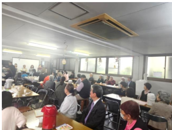
イースター祝会の様子