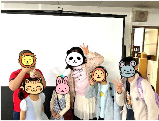
イースター祝会後の子どもたち

成人クラスは、礼拝後にホールで行っています。出エジプト記の学びを5月で終え、6月からはレビ記に入ります。いつからでも、どなたでもご参加ください。